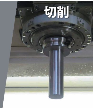
BT50 MAS II 3,000rpm