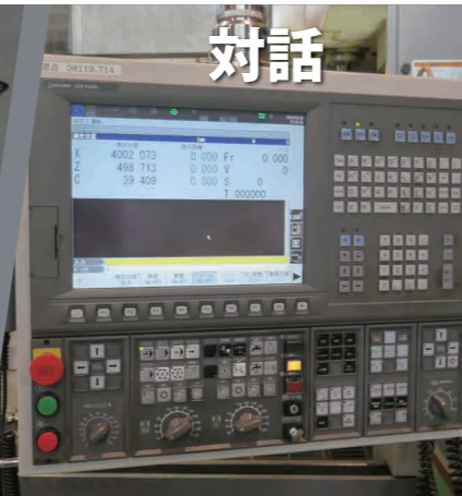
らくらく対話アドバンス

お問い合わせ先 東信機工株式会社 東京都中央区日本橋人形町2-2-6 堀口第二ビル8F TEL:03-3663-6541 FAX:03-3663-6543